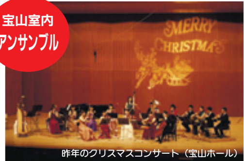
昨年のクリスマスコンサート（宝山ホール）