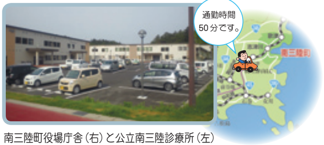
南三陸町役場庁舎(右)と公立南三陸診療所(左) (平成24年3月27日完成)

が見えてきます。通学時間と重なるとスクールバスも多く、整備されている道路が限られているため、通勤通学の車で混雑しています。市街地は依然として建物の基礎だけが残っている状態ですが、少しずつ被災した建物の解体工事も進み、風景も絶えず変化しており、復興に向けて着実に前進しています。 (上田)