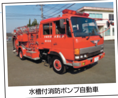
水槽付消防ポンプ自動車

水槽付消防ポンプ自動車 1台 車名 日野 レンジャー 初度登録年月 平成元年10月 種別・用途・形状等 普通・特殊・家用・消防車 型式・総排気量 P・FD172BA改・6・72ℓ