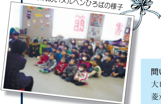
ふれあいメルヘンひろばの様子