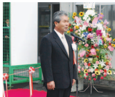
▲神園勝喜伊佐市長職務執行者