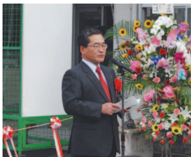
▲伊藤祐一郎鹿児島県知事