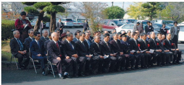
▲菱刈庁舎での参列者