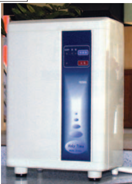
製品寸法 高345×幅238×奥行152mm