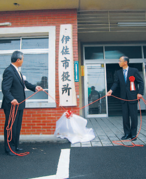
◀大口市舎での銘板披露