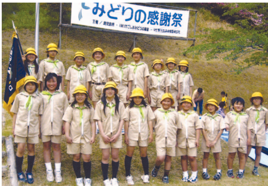
▲高熊山「緑の少年団」