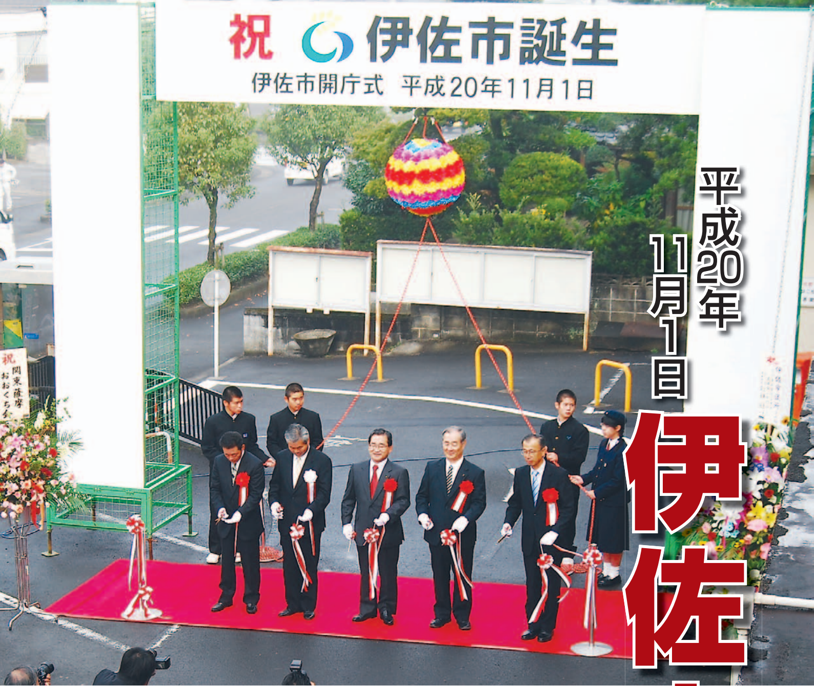
▲大口庁舎でのテープカット

11月1日（土）、大口市と菱刈町が合併して『伊佐市』が誕生し、伊佐市役所大口庁舎で開庁式が行われました。 式典には、伊藤祐一郎鹿児島県知事をはじめ、旧市町長・議長、県関係者、市民、職員など約300人が参加。新しい伊佐市役所の銘板披露や来賓祝辞、テープカット・くす玉割りなど