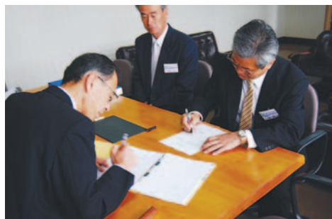
▲大口市長から職務執行者へ引継ぎ