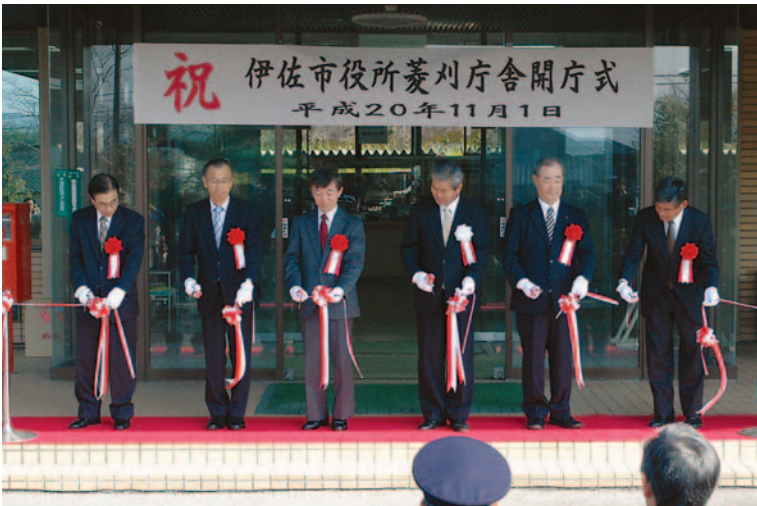
▼菱刈庁舎でのテープカット