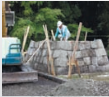
▲現在建立中の「二才咄格式定目」の石碑

11月14日(日)に忠元神社境内において関係者約200人を招待して、没後400年祭を開催します。内容は神事、居合、詩吟、棒踊り、地元手踊りの奉納と、現在忠元神社境内に建立中の「二才咄格式定目」の石碑(原文)の除幕式を行います。