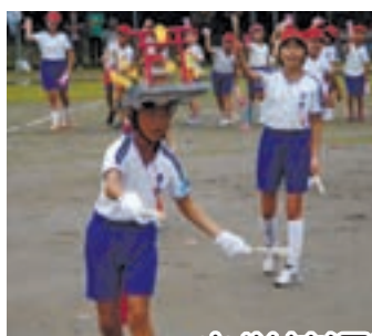
小学校運動会 『雨に負けるな！伊佐の子』

10月3日、市内各地で行なわれた小学校の運動会。これまでの練習の成果を発揮しようとする子ども達でしたが、天候は雨。何度となく競技中断を余儀なくされ、雨に濡れながらの必死の姿に、集った観客からは大きな拍手と声援がおくられました。運動会は初めての1年生と、小学校最後だった6年生にとっては、少し寂しい運動会となりましたが、雨の中、寄り添いながら頑張った今年の運動会は、大人になっても記憶に残る1日になることでしょう。