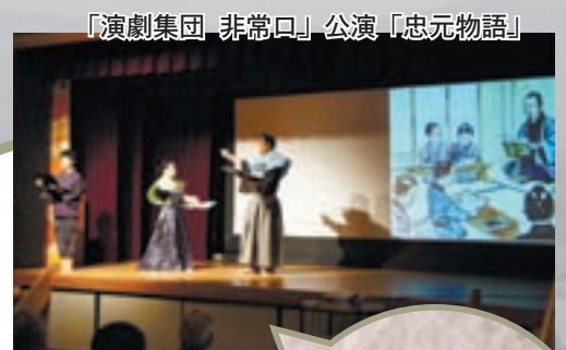
「演劇集団 非常口」公演「忠元物語」