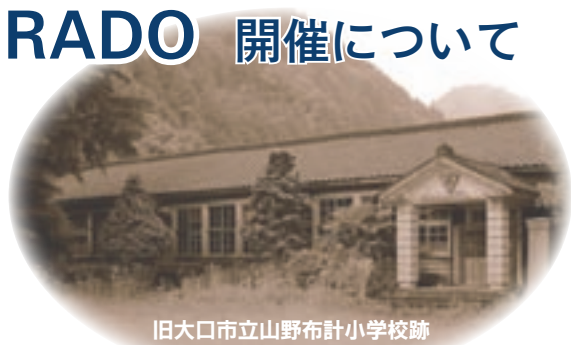
旧大口市立山野布計小学校跡