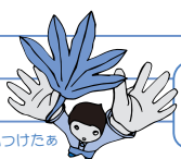
小さい秋！見つけたあ

※こころ館：大口元気こころ館 まごし館：菱刈総合保健福祉センター ふれセン：大口ふれあいセンター 菱刈トレセン：菱刈農業者トレーニングセンター 西太良コミュニティ：西太良コミュニティセンター