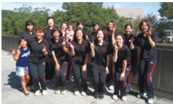
第11回全国社会人9人制バレーボール大会出場 大口クラブ