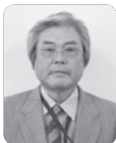
中間 講記 61歳 東市山