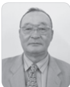
工 昭市 66歳 前日本町