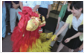
▲「獅子舞がやって来た」 佐賀県多久市から「孔子の里の獅子舞音楽隊」が来庁。