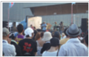
▲「歌津夏まつり」 8月11日福幸商店街にて夏まつり開催。