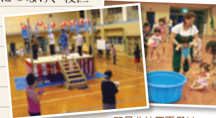
羽月北校区夏祭り