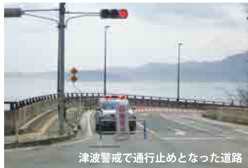
津波警戒で通行止めとなった道路