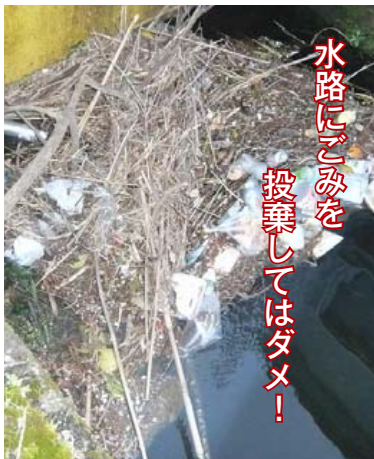
水路にごみを投棄してはダメ！

下流の水門等にごみが堆積し、用水路を利用する人が大変困っています。用水路にごみのごみは止めましょう。