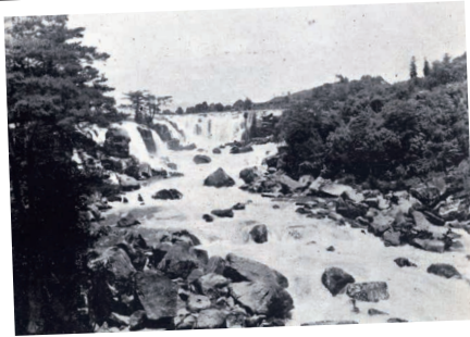
別名を「すずれ滝」とも呼び、増水時の水の景観は圧巻。(昭和 35 年頃)