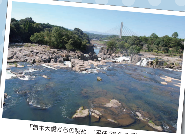
「曾木大橋からの眺め」(平成 26 年 7 月)