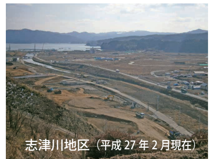
志津川地区 (平成 27 年 2 月現在)