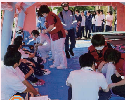
「救急の日」に伴う想定訓練