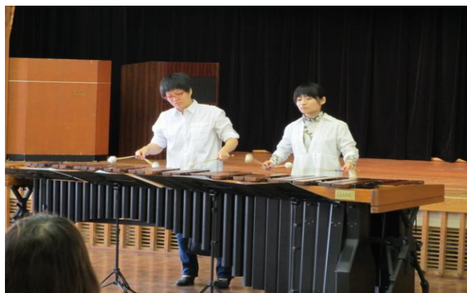
#32 ミニ・コンサート