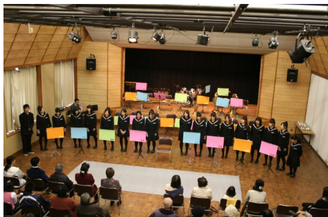
#28 ミニ・コンサート