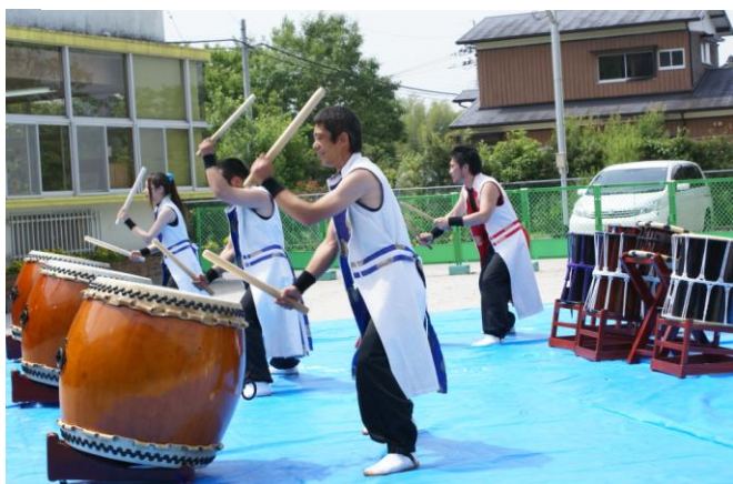
#29 アウトリーチコンサート