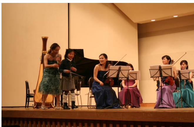
#27 おんがくの種まきコンサート