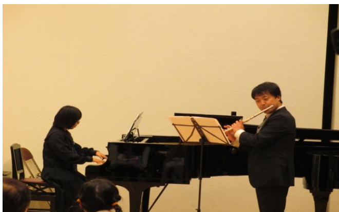
#33 ミニ・コンサート