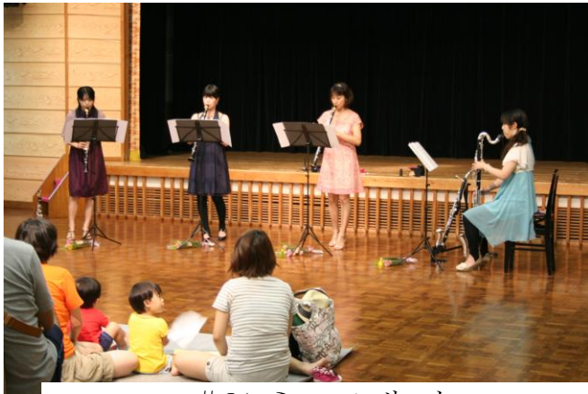
#21 ミニ・コンサート