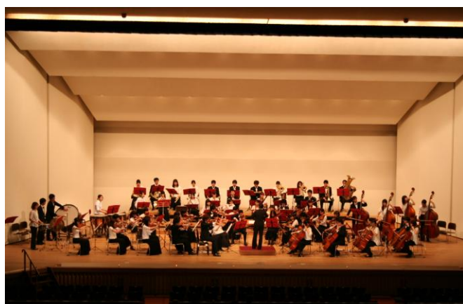
#23 ホールコンサート