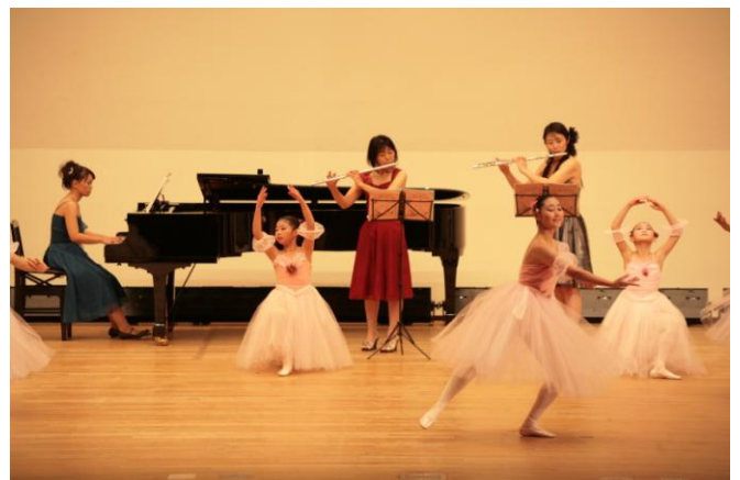
#11 クリスマスコンサート