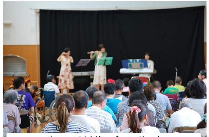
#20 アウトリーチコンサート