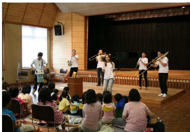
#30 ミニ・コンサート