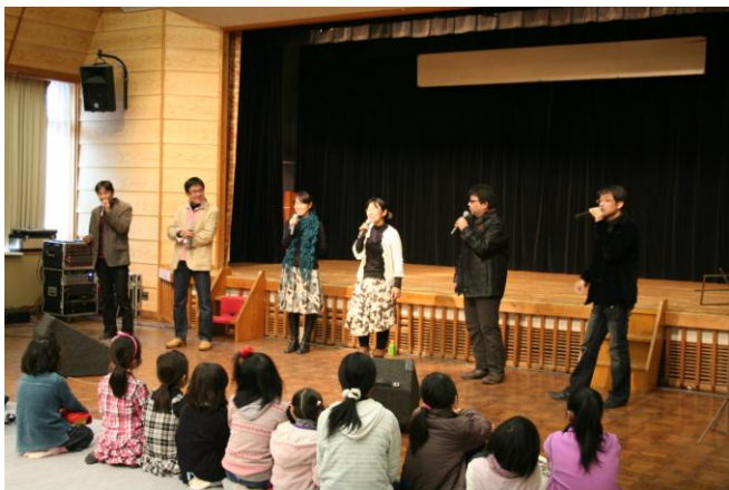
#14 ミニ・コンサート