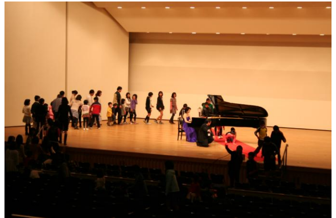
#15 ホール・コンサート