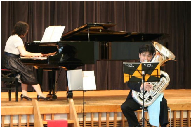
#18 ミニ・コンサート