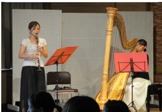
#31 ミニ・コンサート