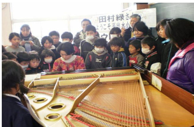
#12 アウトリーチコンサート