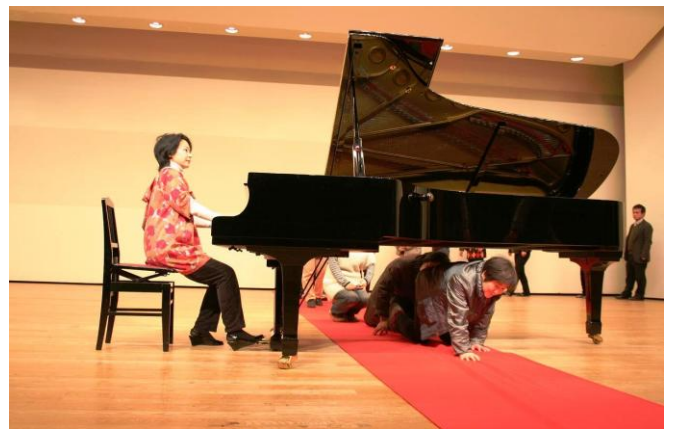
#13 ホール・ワークショップ