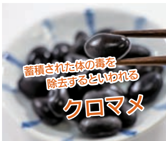
蓄積された体の毒を 除去するといわれる クロマメ

また、クロマメはむくみを取り除く利尿作用や血の巡りをよくする活血作用があるとされ、新陳代謝が活発になるといわれています。ク