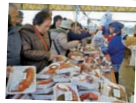
年末に「おすばで（酒の肴祭り）」が開催予定です。毎年、海産物を買求めるお客さんで賑わいます。

綺麗な姿勢を保つと、身体のバランスを整えることができます。自分の弱い筋肉をトレーニングしていきましょう。