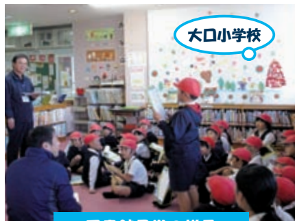
図書館見学の様子

※菱刈図書館ではブックリサイクルコーナーを常設しています。定期的に入れ替えていますので、ぜひご利用ください！