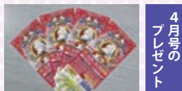
4月号のプレゼント 木下大サーカスのチケット 4名様: 1組4枚(全16枚)