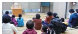
クリスマスおはなし会の様子