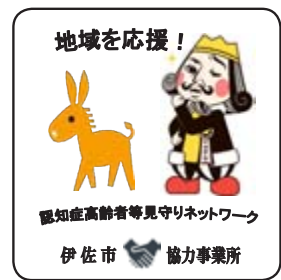
▲ステッカー（イメージ）

市では地域と行政で情報を共有する認知症高齢者等見守りネットワークを推進しています。「家が分からずに帰れない」「何度も同じ話を繰り返す」など、地域で気になる高齢者について、業務に支障のない範囲で情報をいただき、認知症高齢者等の早期発見、早期予防に努めながら必要な在宅支援につなげていきます。 認知症高齢者等に対する対応力を高め、地域と住民が一緒になって認知症に対する理解を深めてい