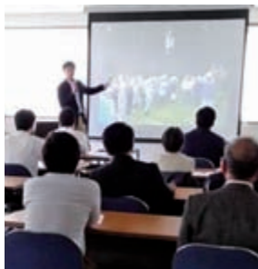
△野村氏によるセミナーの様子

る、人が戻ってくる、そん なサイクルにつながるの はないでしょうか。 飛騨市との交流から 今回は、すでに身近な薬 草を利用したまちづくりを 行っている岐阜県飛騨市と 交流しながらスタートさせ ました。