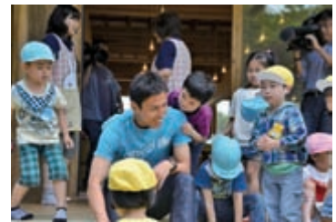
園児と遊ぶ長谷部選手

いくつになっても続ければ効果が期待できます。体幹トレーニングで、健康づくりを行いましょ。