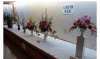
▲大口明光学園 華道部 展示