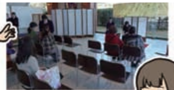
▲大口明光学園 茶道部 実演