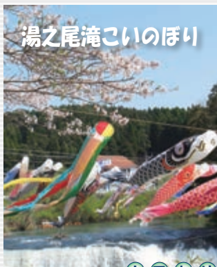
湯之尾滝こいのぼり

湯之尾滝の青空に約300匹のこいのぼりが雄々と泳いでいます。5月14日頃まで楽しそうに泳いでいます。ぜひ、ご覧ください。※こいのぼりのほとんどが寄贈されたものです。