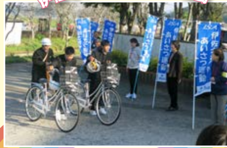
○菱刈中学校(写真) ○大口中央中学校