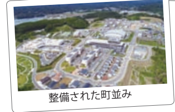
整備された町並み