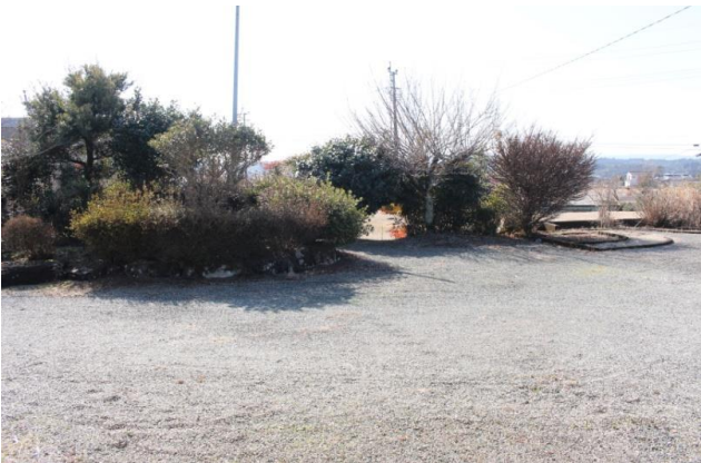
玄関から1歩踏み出した視界