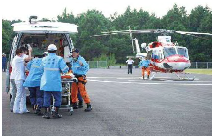
北薩ヘリポート開港式