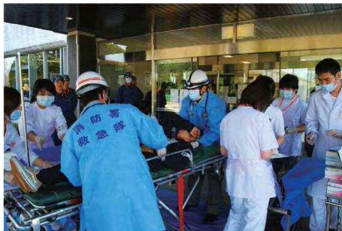
県立北薩病院 防災訓練