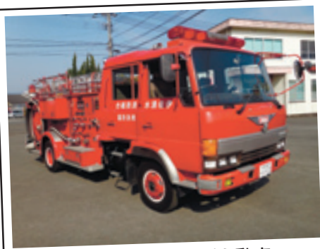
水槽付消防ポンプ自動車

り行います。公開日に入札物件を確認されなくても入札に参加できますが、入札物件に関する事項を了承