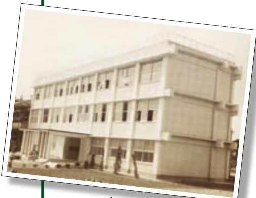
▲昭和36年当時の校舎