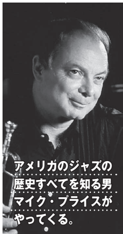
アメリカのジャズの歴史すべてを知る男 マイク・ブライスがやってくる。