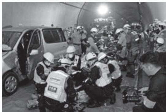
平成29年10月の防災訓練