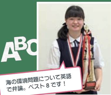
海の問題について英語で弁論。ベスト8です!