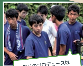
祭りのプロデュースは下見から念入りに!