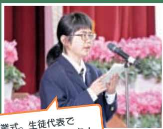
先輩の卒業式。生徒代表で感謝を込めて送りました!

今は進学に向けて勉強しながら、サッカー部キャプテンとして、9月の大会のために練習しています。大変ですが、将来は大好きなスポーツに携わる仕事に就きたいと思っていますので、そのために今できることを精一杯頑張りたいです。