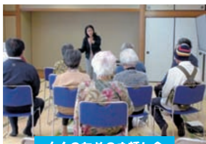
大人のためのお話し会

※菱刈図書館ではブックリサイクルコーナーを常設しています。定期的に入れ替えていますので、ぜひご利用ください！