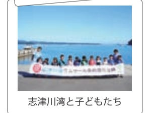
志津川湾と子どもたち

予定です。観光振興や水産物ブランドへの活用など、条約の波及効果にはさまざまな可能性を感じます。海と共存するまちづくりをめざす南三陸にとって、大きな指針となることを期待しています。(若宮健太郎)