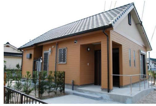
(菱刈川北地区 1号棟)

〒895-2511 伊佐市大口里 1888 番地 Tel:0995-23-1311 Fax:0995-22-5344