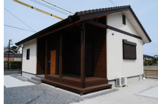
(菱刈川北地区 2号棟)