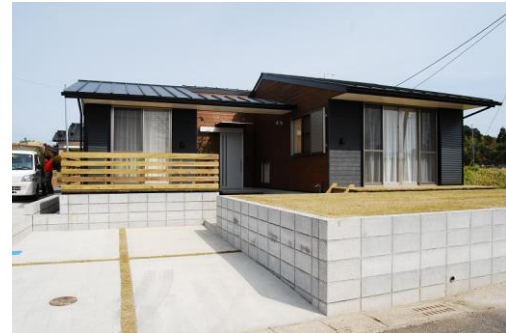
(菱刈重留地区 4号棟)