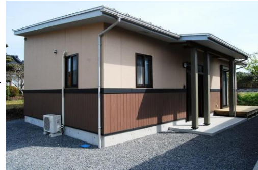
(菱刈重留地区 3号棟)