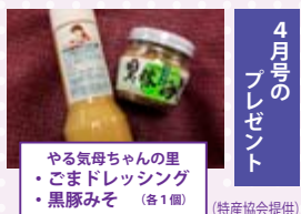
4月号のプレゼント