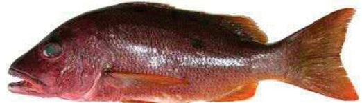
イッテンフェダイ