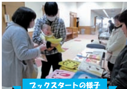
ブックスタートの様子

※菱刈図書館ではブックリサイクルコーナーを常設しています。定期的に入れ替えていますので、ぜひご利用ください！