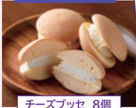
チーズブッセ 8個 (トリコロール)