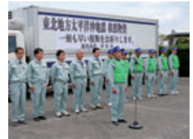
伊佐派遣隊 東北へ (2011年4月5日)

2011年5月号『東日本大震災のニュース。あまりにも非現実的でどこか遠いところの話と感じている人もいるかもしれません。それが、募金活動や支援物資の送付で心が少し近づいた。同僚の派遣で身近な出来事になった。派遣職員の報告から、がれきの山が私の目の前にも見えた。被災地の方の声がかすかに聞こえた。帰る場所がある私たちに、どんなお手伝いができるのか、どんな言葉をかけてあげられるのか、答えはないまま熱い「何か」で被災地へ向かっています。ある派遣隊の出発の朝、父を見送る高校生を見ました。送迎車に近づき、人目も気にせず、何度も手を振り「気をつけて、気をつけてね」と叫び続けていました。