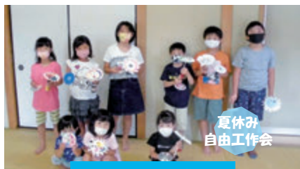
夏休み自由工作会