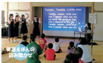
英語えほんの読み聞かせ