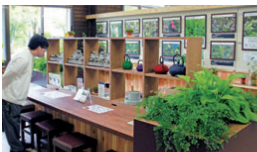
▲野草薬草館では、野草薬草の効能や調理方法を解説しています。発電所遺構展望公園内の野草の杜とあわせて訪れたいスポットです。