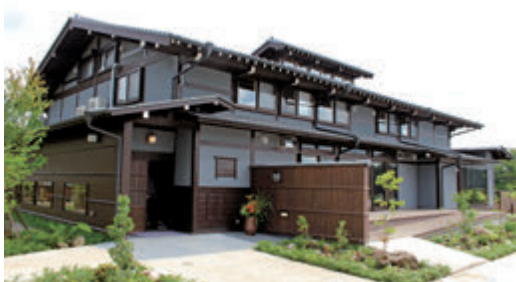
▲野草庵おばあちゃん家では、カラダにやさしい野草薬草料理を堪能できます。