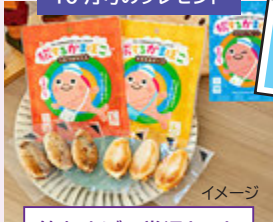
笹かまぼこ常温セット

【投稿・問い合わせ先】 〒895-2511 伊佐市大口里2845番地2 伊佐PR課 「和みのひろば」係 ☎04113 ☎09420 ✉koho@city.isa.lg.jp