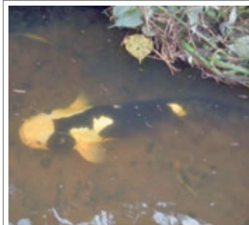
7月21日の夕方、菱刈の田んぼ水路内に金色ナマズが佇んでいました。(湯之尾 H・N 70代)

チュロスさん、イベントはありませんでしたが、子どもたちにとっては家族の絆が深まる素晴らしい夏休みになりましたね！