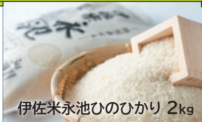
伊佐米永池ひのひかり 2kg