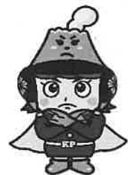
さくらロールちゃん