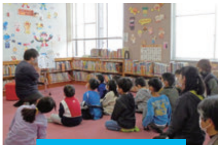
メルヘンひろばの様子

※菱刈図書館ではブックリサイクルコーナーを常設しています。定期的に入れ替えていますので、ぜひご利用ください！