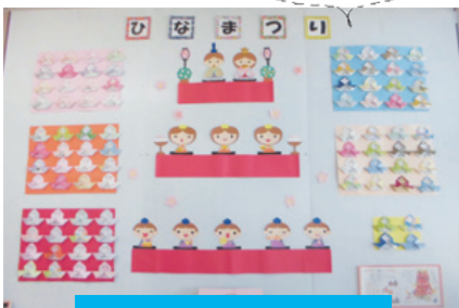
ひなまつりの展示