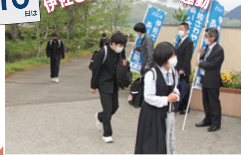
4月活動 ○菱刈中学校