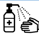
手指消毒用アルコール による消毒の励行

新型コロナワクチンの有効性・安全性などの詳しい情報については、厚生労働省ホームページの「新型コロナワクチンについて」のページをご覧ください。