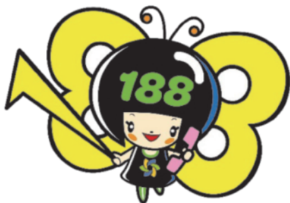
消費者庁 消費者ホットライン188 イメージキャラクター 「イヤヤン」

そんなときは一人で悩まずに、全国どこからでも3桁の電話番号でつながる消費者ホットライン「188（いやや!）」にご相談ください。専門の相談員がトラブル解決を支援します。