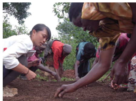
ウガンダの人と実施していた畑活動の様子

まず「伊佐を知る」ことが活動の始まりですので、いろいろな方にお会いしたいと思います。あちこちをウロウロ探検していると思いますので、地域の活動や