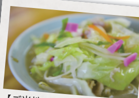
【ご当地グルメ】ちゃんぽん