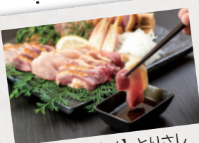
【ご当地グルメ】とりさし