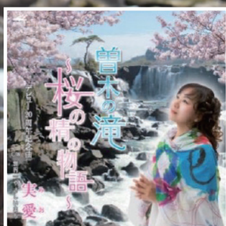
▲曾木の滝 ～桜の精の物語～

「いつも応援していただきあり がとうございます。この歌が幅広 い世代の方々に親しまれ、みなさ まに少しでも恩返しができるよう 精一杯頑張ります。たくさんの愛 が実りますように」