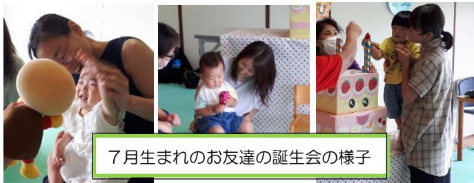
7月生まれのお友達の誕生会の様子