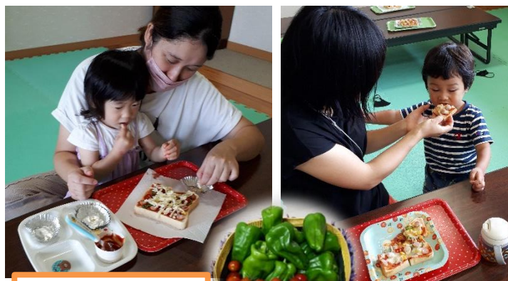
育てた野菜を使ってピザトーストづくり

各ひろばで、来月の運動会ごっこに向けて「万国旗製作」をします。ぜひ、お越しください。